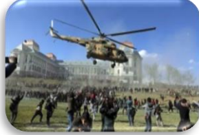
برجسته ترین رویداد این ماه