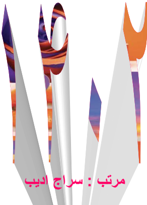
مرتب : سراج ادیب