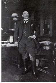
سر هنری مورتیمر دیورند