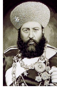
امیر عبدالرحمن خان