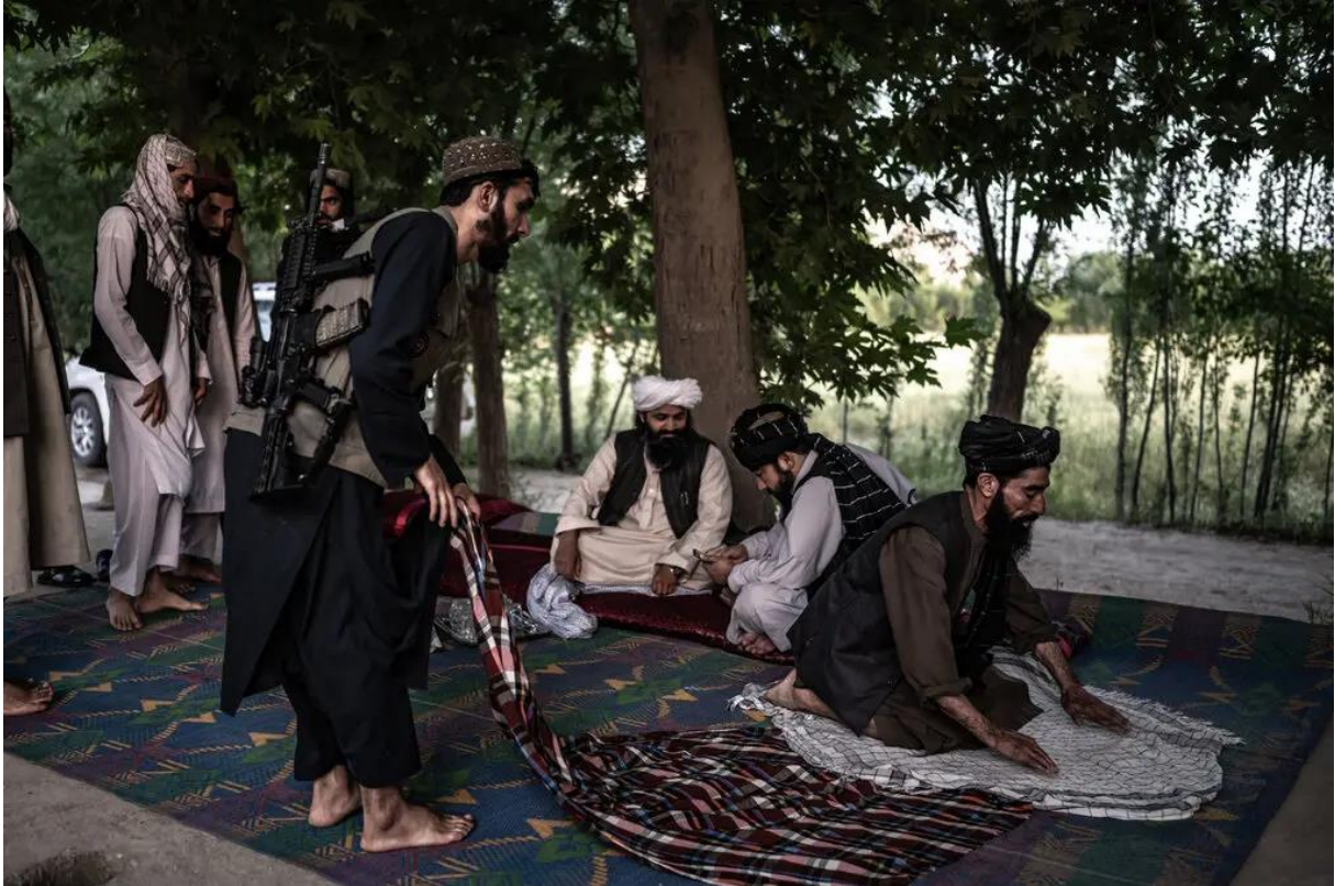
د افغانانو یوه ډله بهر په غالی کې راتولیدي. یو پوځي توپک لري. بل په لمانځه کې سجده کوي.

په نهايت کې، ښاغلي عمر له خپلو کسانو سره په شا شو، له دې وپرې چې طالبان به نور ځواکونه واستوي. مگر د ښار څخه د وتلو په لاره کې، د ښه اقدام لپاره، د هغه ملېشو یو ځایي پلورنځی لوت کړ او یو څو ځایي خلک یې ووهل، اوسیدونکو وویل، هغه عملونه چې د ټولني ډیري برخه یې د هغه په وړاندې وگرځوله.