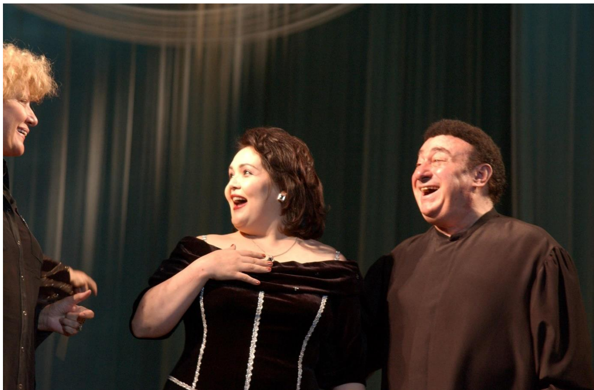
در حین اجرای نقش