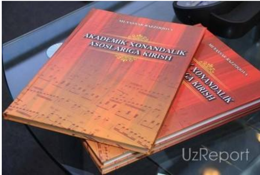
کتاب رزاقوا به اشتراک کنندگان توزیع گردید