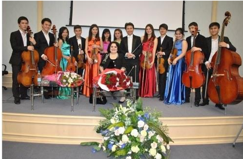
رزاقوا با گروهی از دانشجویان اپرا در مراسم تقدیم کتاب