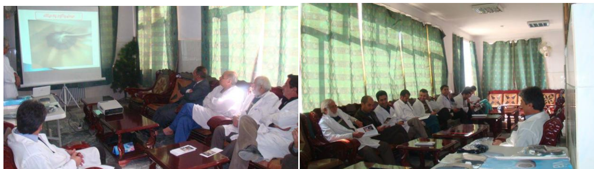
کنفرانس واکوم تراپی سرویس جراحی شفاخانهء علی آباد