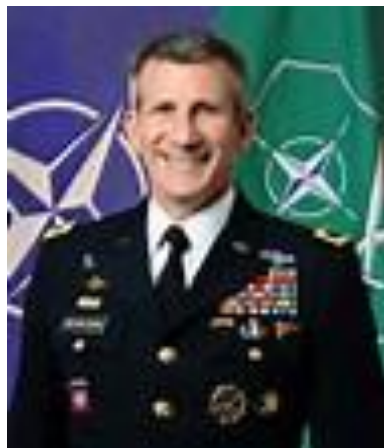
جنرال جان نیکلسون

جنرال جان نیکلسون بعد از آنکه دونالد ترومپ براریکه قدرت در قصر سفید تکیه زد به ماموریت و فرمانده نیروهای نظامی ایالات متحده امریکا در افغانستان مامور گردید که او همچنان این توافقنامه بین دولت افغانستان و گلبدین «حکمتیار» را یک مدل