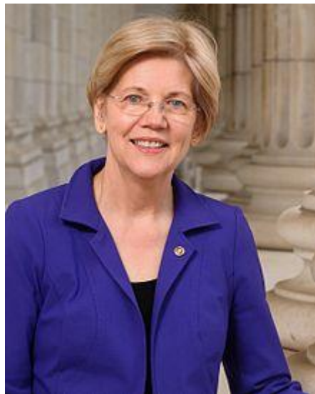
الیزابت وارن (Elizabeth Warren) معاون رییس

مقامات ارشد اداره دونالد ترومپ کاملاً از آنچه که انجام می‌دهند آگاه هستند چنانچه که سناتور الیزابت وارن (Elizabeth Warren) اخیراً وزیر دفاع ایالات متحده امریکا را درباره استراتژی دولت امریکا در قبال افغانستان مورد سوال قرار داد و او وضعیت اولیه را تایید کرد.