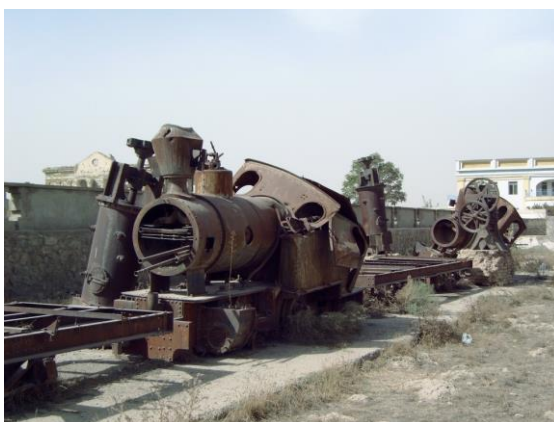
نخستین خط ریل در افغانستان

در زمان اعلیحضرت غازی امان اله خان کارخانجات تولیدی و صنعتی بشکل منظم از خارج کشور خریداری و بکشور انتقال داده شد و در تمام عرصه ها دستگاهی کوچک و بزرگ ساخته شد و افغانستان با جهان خارج از راه صنعت و انکشاف صنایع راه پیدا کرد.