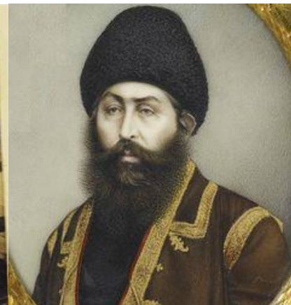
امیر شیر علیخان