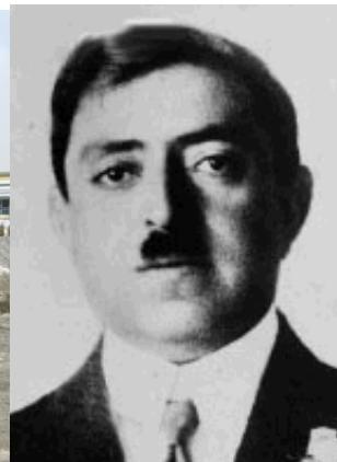
غازی امان اله خان

در زمان غازی امان الله خان توريد فابریکه دستگاههای صنعتی و تمديد خط آهن بکشور به کمک کشور جرمنی و دیگر کشورهای اروپایی و ایجاد بیشترین کارخانجات در تمام