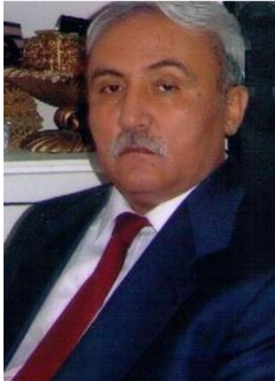
استاد - صباح