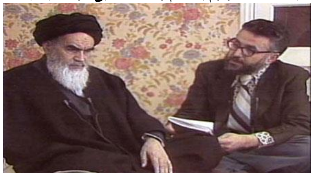
ابراهیم یزدی، نماینده خاص خمینی در ملاقات پنهانی با امریکا که بعدها در پست‌های مهم رژیم جمهوری اسلامی کار کرد.

متن نامه خمینی برای قتل عام زندانیان سیاسی در تابستان ۱۳۶۷: «از ابتدای تشکیل نظام جمهوری اسلامی تاکنون، کسانی که در زندانهای سراسر کشور بر سر موضع نفاق خود پافشاری کرده و می‌کنند محارب و محکوم به اعدام میباشند.... امیدوارم با خشم و کینه انقلابی خود نسبت به دشمنان اسلام رضایت خداوند متعال را جلب نمایند.»