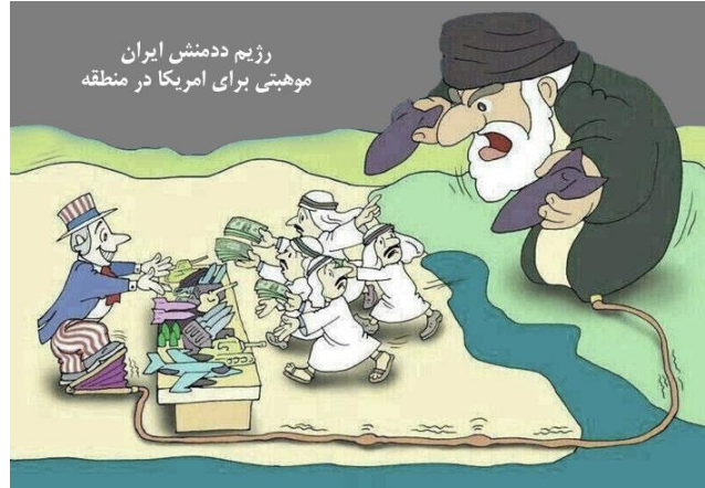
رژیم ددمنش ایران، موهبتی برای امریکا در منطقه

اگر اختلافات میان سران جنایتکار این کشور ها، عوافریبانه نمی‌بودند و رژیم فاشیستی ایران تهدید خطرناک برای امریکا می‌بود، سوال اینجا برمی‌خیزد که چگونه این کشور زیر ریش سیا به سلاح هسته‌ای دست می‌یابد و همچون رژیم صدام مورد حمله نظامی قرار نمی‌گیرد؟ این دیگر بر همگان هویداست که دولت‌های امریکا و ایران از بازی موش و پشک با یکدیگر، هر دو جانب منفعت بزرگ می‌برند ولی در انتها این ملت دریند ایران است که تمام بدبختی را متحمل می‌شوند.