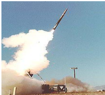
تاد(دایو ډول ضد بالیستیکی توغندی دی چی دخپل محرک انرژي سره دشمن توغندی خنثی کوی

هغه دوم ډول ضد بالیستیکی سیستم توغندی چی د (THAAD) په نوم سره یادیری او د ځان سره موبایل تیلیفون هم لری د امریکې د ځمکنی قوتونو په اختیار کی دی چی دهغه دنده د سرتیرو ساتنه په هغو سیمو کی دی کوم چی امریکایی ځمکنی سرتیری هلته راپلی کیری او یا هلته ځای پر ځای کیری