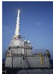
ام-اس ۳- مخ په هوا بالیستیکی توغندی

د امریکې د متحدہ ایالاتو اعزازی سمندری نظامی ځواکونه او هغه سیمی ته کوم چي دغه سمندری ساتونکی له انتقالی بیرویو څخه راپلی کیری دخپل ساتنی دپاره څو ډول ضد بالیستیکی محافظوی سپرونه په اختیار کی لری چی یو ددی محافظوی سپرونو څخه د ایجیس (AEGIS) په نوم سمندری سیستم توغندی دی چی د اس ام ۳ (SM-3 1b) په نوم یو امریکایی مخ په هوا توغندی دی چی پر بیرویو باندی نصب شوی دی او تل د تیار سیی په حالت کی تر قوما ندی لاندی اعیار کرل شوی دی او ددی ډول توغندیو یوه دستگاہ په پولیند او دهغه بل دستگاہ په روما نیه کی د امریکې د متحدہ ایالاتو د سمندری قوتونو له خوا ځای پر ځای شوی دی چی دهغه څخه پر روسیې باندی دیر غل په وخت کی کار اخیستل کیری چی ددی ډول توغندی نمونه په لاند نی تصویر کی بنودل شوی دی