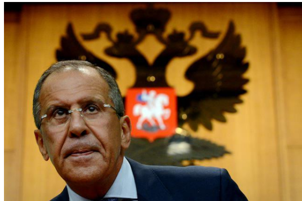
سرگی لاروف وزیر خارجه روسیه

کریملین قصدش را برای بمیدان رفتن یک نیروی مرکب سهمگین برای حفاظت منافع سیاسی و اقتصادی آن کشور تا به 2020 در منطقه قطبی تکرار کرد. با وارد شدن به 2015، تخمین زده می شود که نیروهای مسلح روسیه در حدود 56 فرودند طیارات نظامی و 122 فرودند هلیکوپتر در منطقه قطبی داشته باشد. سرگی شایگو وزیر دفاع روسیه ابراز داشته که 14 میدان هوایی نظامی در کرانه های قطبی روسیه تا به اخیر امسال قابل استفاده خواهند شد. وزیر دفاع همچنان گفت که بعضی از 50 فرودند میگ -31 BM نوع فکسهند (Foxhound) راهگیر، نوسازی شده تا به 2019 بر فراز منطقه قطبی به وظایف دفاعی گماشته می شوند. با وجود معضلات طاعون اقتصادی روسیه، وزارت دفاع ترتیبی داد تا از قطع بودجه بطور معنی داری فرار نماید، که در مورد سایر وزارت خانه ها تحمل شده بود. درحقیقت، کریملین مصارف نظامی را تا به 20 درصد بلند برده است، که شاخص روشن اولویت روسیه برای 2015 و محتملا نشانگر اینست مسکو قصد دارد تا به تعهدات نظامی اش دست یابد.