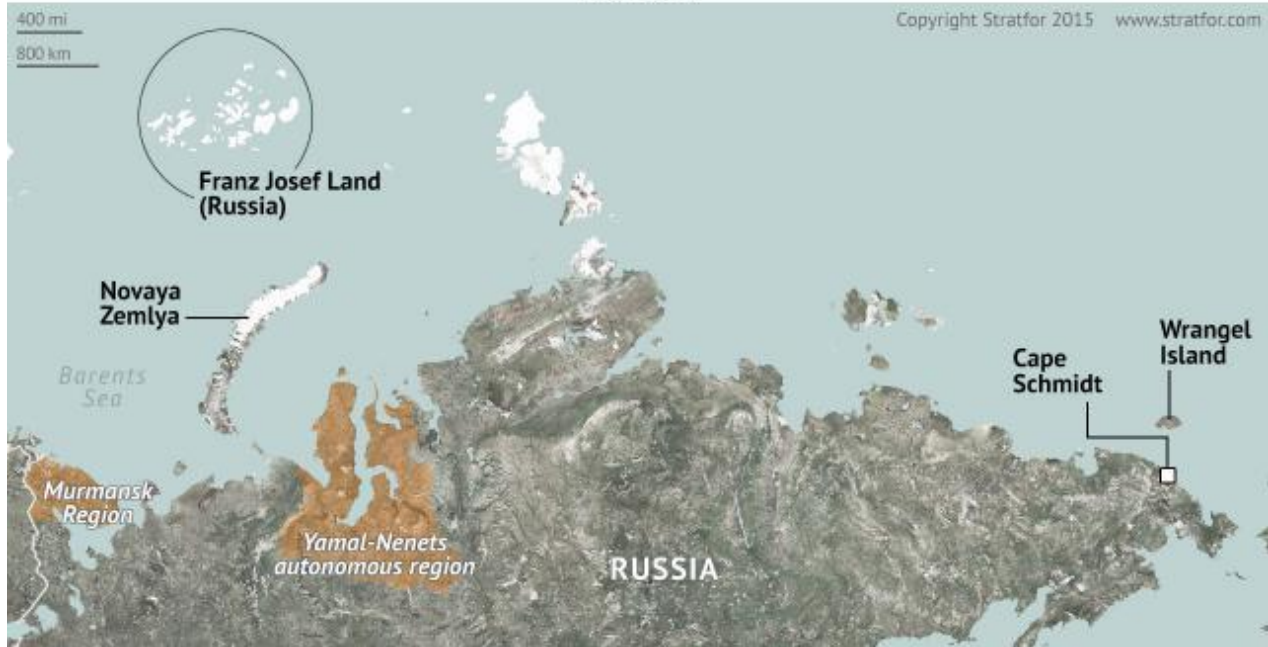
نمایه جغرافیائی روسیه

کریملین قصدش را برای بمیدان رفتن یک نیروی مرکب سهمگین برای حفاظت منافع سیاسی و اقتصادی آن کشور تا به 2020 در منطقه قطبی تکرار کرد. با وارد شدن به 2015، تخمین زده می شود که نیروهای مسلح روسیه در حدود 56 فرودند طیارات نظامی و 122 فرودند هلیکوپتر در منطقه قطبی داشته باشد. سرگی شایگو وزیر دفاع روسیه ابراز داشته که 14 میدان هوایی نظامی در کرانه های قطبی روسیه تا به اخیر امسال قابل استفاده خواهند شد. وزیر دفاع همچنان گفت که بعضی از 50 فرودند میگ -31 BM نوع فکسهند (Foxhound) راهگیر، نوسازی شده تا به 2019 بر فراز منطقه قطبی به وظایف دفاعی گماشته می شوند. با وجود معضلات طاعون اقتصادی روسیه، وزارت دفاع ترتیبی داد تا از قطع بودجه بطور معنی داری فرار نماید، که در مورد سایر وزارت خانه ها تحمل شده بود. درحقیقت، کریملین مصارف نظامی را تا به 20 درصد بلند برده است، که شاخص روشن اولویت روسیه برای 2015 و محتملا نشانگر اینست مسکو قصد دارد تا به تعهدات نظامی اش دست یابد.