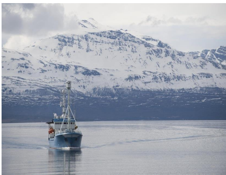
اهمیت روز افزون شورای منطقه قطبی

در آخر سال 2014، روسیه فرماندهی راه بردی متحدی را تاسیس کرد که در حوالی ساختار های فرماندهی فعلی ناوگان شمالی موقعیت دارد. این ساختار قدرت دسترسی نظامی را در سراسر جزایر مناطق شمالی روسیه ( Russia's northern territories ) با موفقیت تسهیل کرده، و احتراز از اشتباه نظری و کنترل راه تجاری از چین تا ناروی را ممکن می سازد. این ساختار همچنین برای مقاصد دیده بانی و استراق سمع - و بر رسی های بالقوه- در صورت هر حرکت نظامی توسط هر قدرت دیگری در منطقه خدمت میکند.