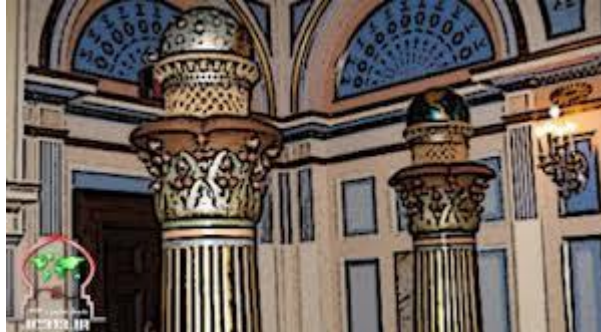
نظم دنیوی جهانی